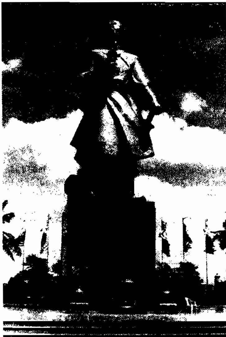
Tượng Hưng Đạo Vương Trần Quốc Tuấn ở Nam Định

Vương Công Kiên (7) là người thế nào, tì tướng của ông là Nguyễn Văn Lập lại là người thế nào, mà giữ thành Điều Ngự (8) nhỏ như cái đầu, đường đường chống với quân Mông Kha (9) đông đến hàng trăm vạn, khiến cho nhân dân đời Tống đến nay còn đội ơn sâu !