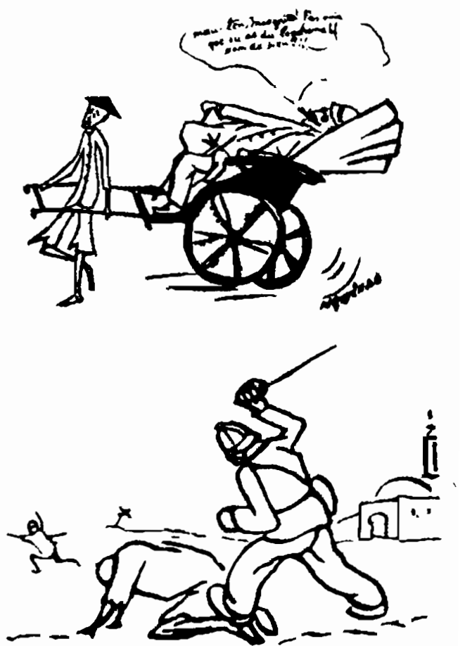
Tranh của Nguyễn Ái Quốc

trò biểu diễn khoa học về phóng ngư lôi (3) , đã được xuống tận đáy biển để bảo vệ tổ quốc của các loài thủy quái. Một số khác đã bỏ xác tại những miền hoang vu thơ mộng vùng Ban-căng (4) , lúc chết còn tự hỏi phải chăng nước mẹ muốn chiếm ngôi nguyên phi trong cung cấm vua Thổ, – chả thế sao lại đem nướng họ ở những miền xa xôi ấy? Một số khác nữa thì anh dũng đưa thân cho người ta tàn sát trên bờ sông Mác-nơ, hoặc trong bãi lầy miền Săm-pa-nhơ (5) , để lấy máu mình tưới những vòng nguyệt quế (6) của các cấp chỉ huy và lấy xương mình chạm nên những chiếc gậy của các ngài thống chế (7) .