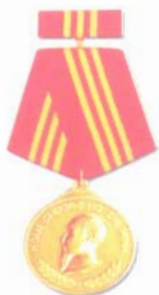
HUÂN CHƯƠNG HỒ CHÍ MINH