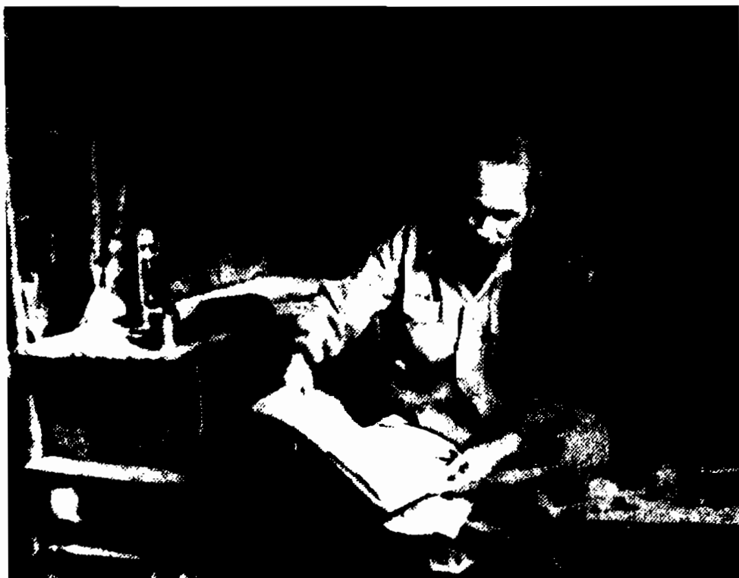
Bác Hồ làm việc trong hang núi ở chiến khu Việt Bắc