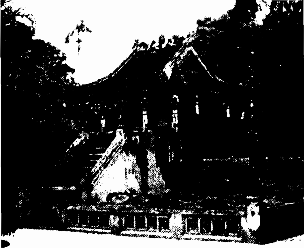
Chùa Một Cột – công trình kiến trúc nổi tiếng của thủ đô Hà Nội được xây dựng từ thời Lí

cho triều đại không được lâu bền, số vận ngắn ngủi, trăm họ phải hao tốn, muôn vật không được thích nghi. Trẫm rất đau xót về việc đó, không thể không dời đổi (8) .