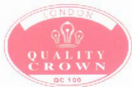
VƯƠNG MIỆN KIM CƯƠNG CHẤT LƯỢNG QUỐC TẾ