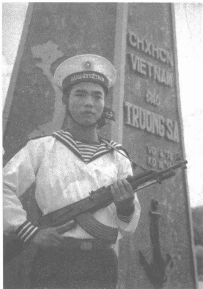
Chiến sĩ hải quân canh giữ đảo Trường Sa Lớn.