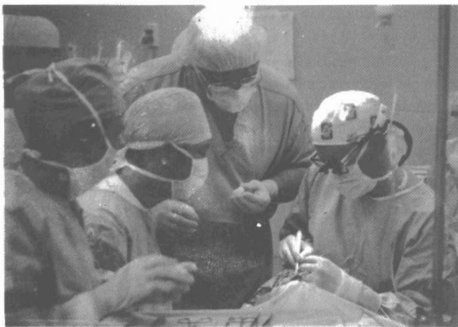
Các bác sĩ Việt Nam và Hoa Kỳ hợp tác tiến hành ca mổ “phẫu thuật nụ cười” cho trẻ em tại bệnh viện Đà Nẵng.