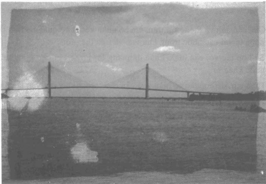
Cầu Mi Thuận, biểu tượng của sự hợp tác Việt Nam - Ô-xtrây-li-a.