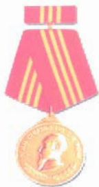
HUÂN CHƯƠNG HỒ CHÍ MINH