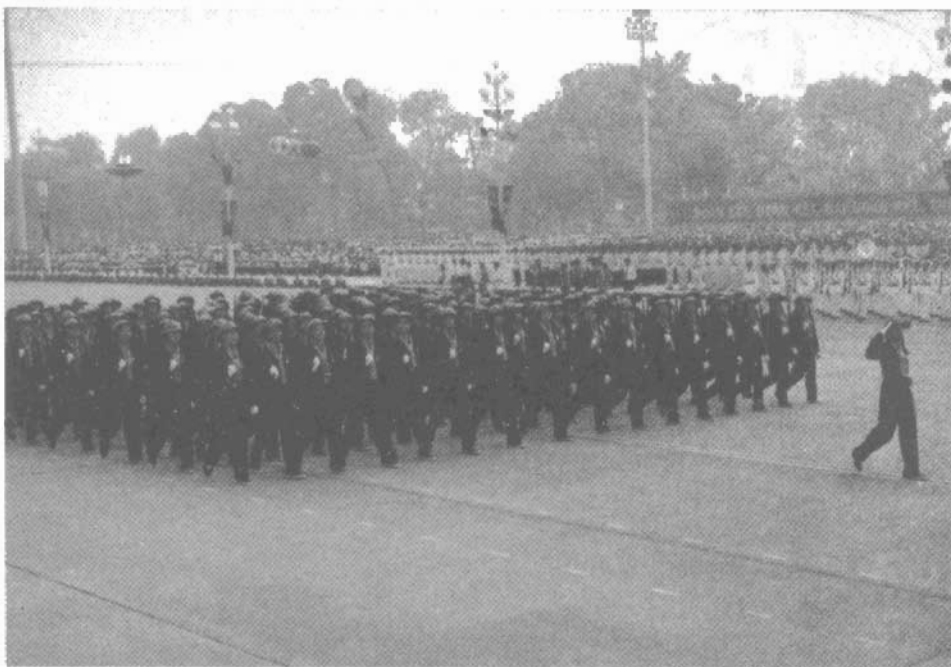
Dàn quân nữ Nam Bộ duyệt binh tại Quảng trường Ba Đình, Hà Nội.